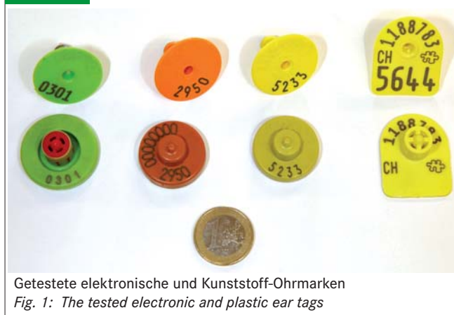
Getestete elektronische und Kunststoff-Ohrmarken Fig. 1: The tested electronic and plastic ear tags

Das Tierseuchengesetz verpflichtet, Schweine spätestens mit dem Absetzen von der Muttersau mit einer Ohrmarke zu kennzeichnen. Ohne den Einsatz elektronischer Systeme entsteht bei der Registrierung und der Aufzeichnung des Verkehrs landwirtschaftlicher Nutztiere ein hoher administrativer Aufwand. Um die Tiere von der Geburt bis zur Schlachtung lückenlos rückverfolgen zu können, ist der Verbleib der Ohrmarke am Tier essentiell. Das Tier muss beim Verlassen des Mastbetriebs noch gekennzeichnet sein, um es im Schlachtbetrieb eindeutig identifizieren, seinem Schlachtergebnis zuordnen und schließlich bis zum Geburtsbetrieb rückverfolgen zu können.