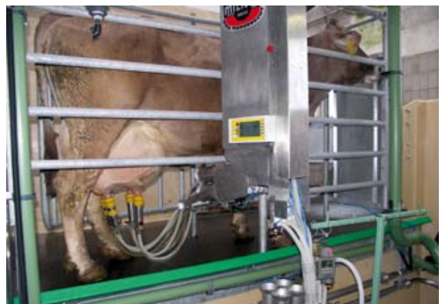
Melksystem MultiLactor ® Fig. 1: Milking System MultiLactor ®