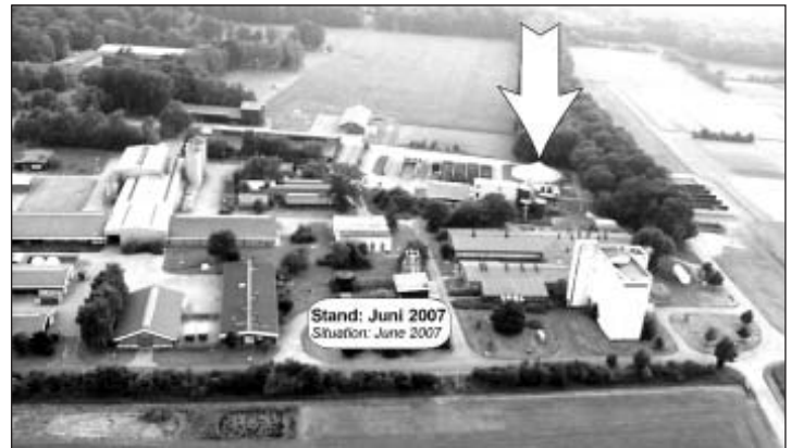
Fig. 1: Linking of a container to the composite slurry system

Dem Bundesrat liegt zur Reduzierung und Beschleunigung immissionschutzrechtlicher Genehmigungsverfahren ein Gesetzentwurf vor, dem aller Voraussicht nach zugestimmt werden wird. Der Umweltausschuss stimmte dem Entwurf mit den zuvor zwischen den Koalitionsfraktionen ausgehandelten Erleichterungen für die Genehmigungsbedürftigkeit von Anlagen zur Tierhaltung bereits zu. Demnach wird die immissionsschutzrechtliche Genehmigung für Betriebe mit mehr als 50 Großvieheinheiten (GVE) und mehr als 2 GVE pro ha vollständig abgeschafft. Außerdem wird eine immissionsschutzrechtliche Genehmigung bei Rinderställen erst ab 600 und bei Kälberställen ab 500 Plätzen vorgeschrieben. Eine entsprechende Entscheidung des Bundesrats wird für Ende September 2007 erwartet.