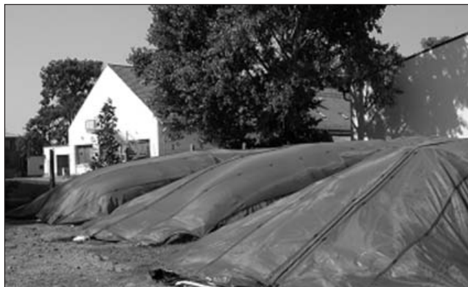
Fig. 2: Film tubes protected with bird nets

bestandteile (Schäben, Bast, Blätter) unterschieden. Von den in der Hanfpflanze vorhandenen rund 30 Masse-% Fasern werden bereits etwa 2/3 durch die Ernte mit dem Häcksler vollständig freigelegt. Eine Verringerung der Häcksellänge führt zu einem exakteren Schnitt. Die Masseanteile in den Größenklassen mit Längen unter 10 mm und über 20 mm reduzieren sich dadurch auf etwa die Hälfte.