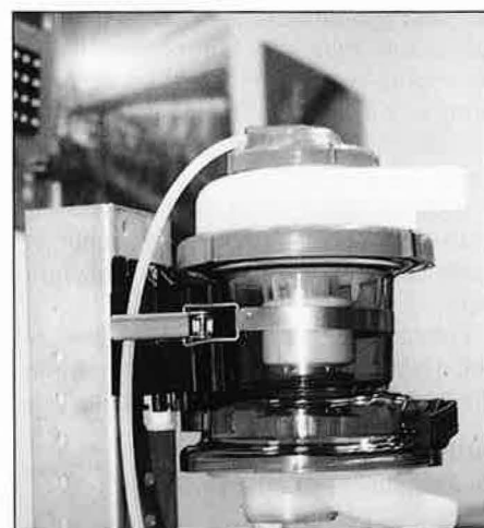
Bild 2: Kompakt gebautes schwimmergesteuertes Milchmengenmeßgerät

Neue Produkte fanden sich bei den Zusatzausrüstungen zur Datengewinnung. Bei Milchmengenmeßgeräten bringen einige Hersteller mittlerweile die zweite Generation auf dem Markt (Boumatic, Bild 2). Zur Mengenbestimmung wird hier, wie bei anderen aktuellen Geräten auch, zunächst der Milchfluß bestimmt und daraus dann anhand der Entleerung der Meßkammer innerhalb bekannter Zeit die durch das Gerät geflossene Milchmenge berechnet. Dieses auf den ersten Blick aufwendige Verfahren ermöglicht einen einfachen mechanischen Aufbau, da der